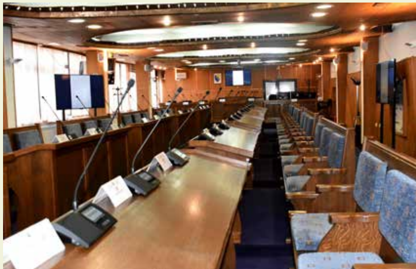
Конференцијска сала Скупштине Брчко дистрикта БиХ