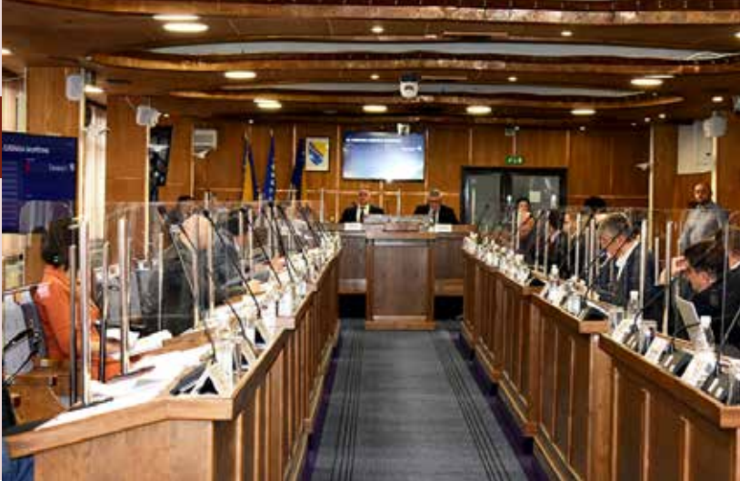
22. редовна сједница Скупштине