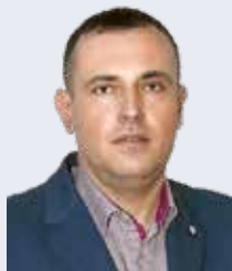
Врчачевић Дражен (Уједињена Српска)