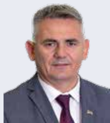
Предсједник Милић Синиша (СНСД)