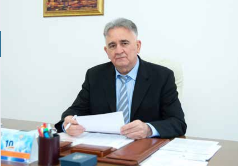
Иво Филиповић, потпредсједник Скупштине Брчко дистрикта БиХ