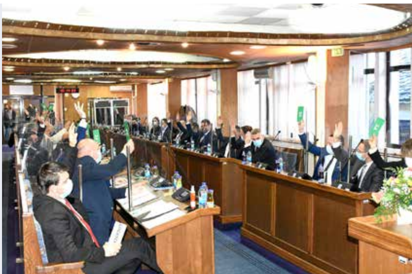
Конститутивна сједница Скупштине Брчко дистрикта БиХ 23. 12. 2020.