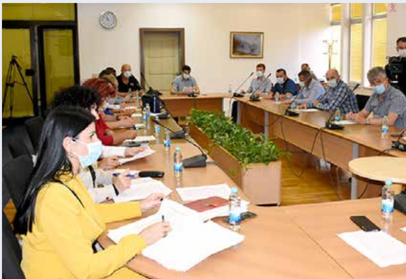
Припремни састанак 2. 9. 2021.