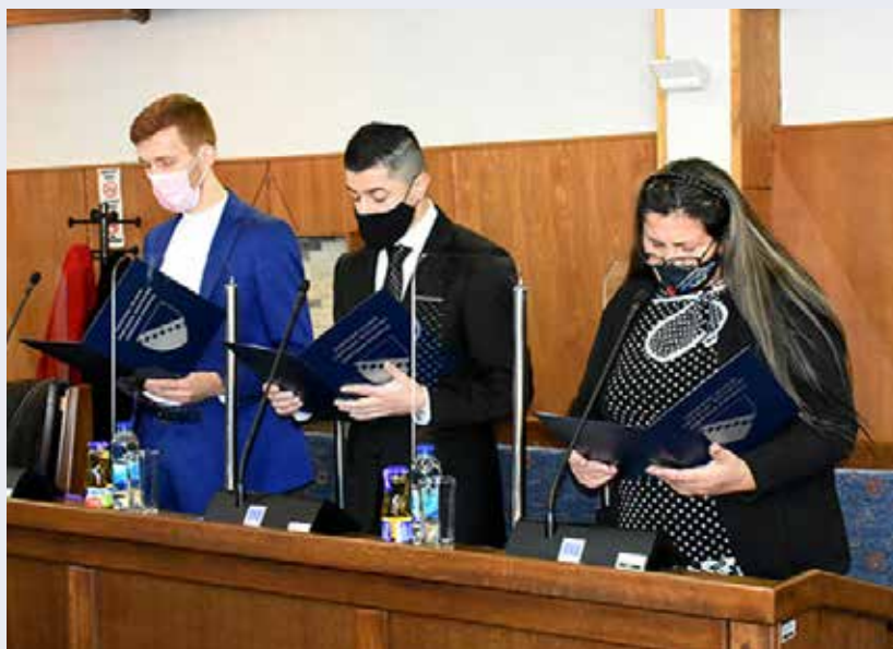
Конститутивна сједница Скупштине Брчко дистрикта БиХ 23. 12. 2020.