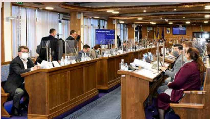
22. редовна сједница Скупштине