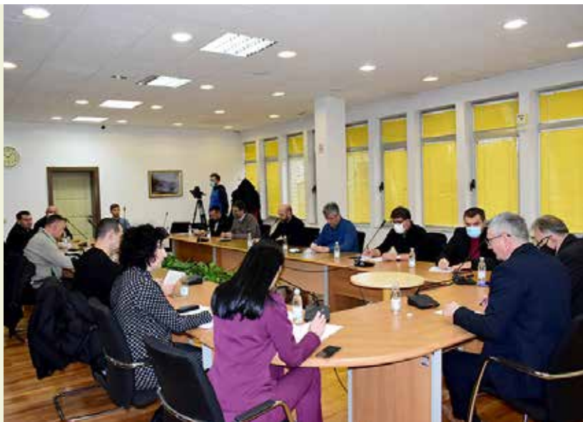
Припремни састанак за 18. редовну сједницу Скупштине

Потребна су најмање два (2) читања на редовно заказаним сједницама Скупштине прије усвајања нацрта закона, осим у случају из члана 76 Пословника.