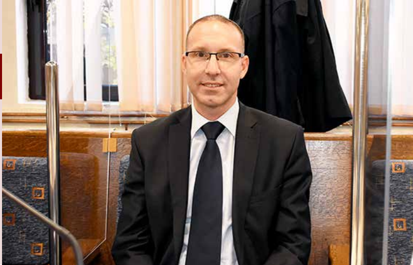
Љубиша Лукић, председавајући Законодавне комисије