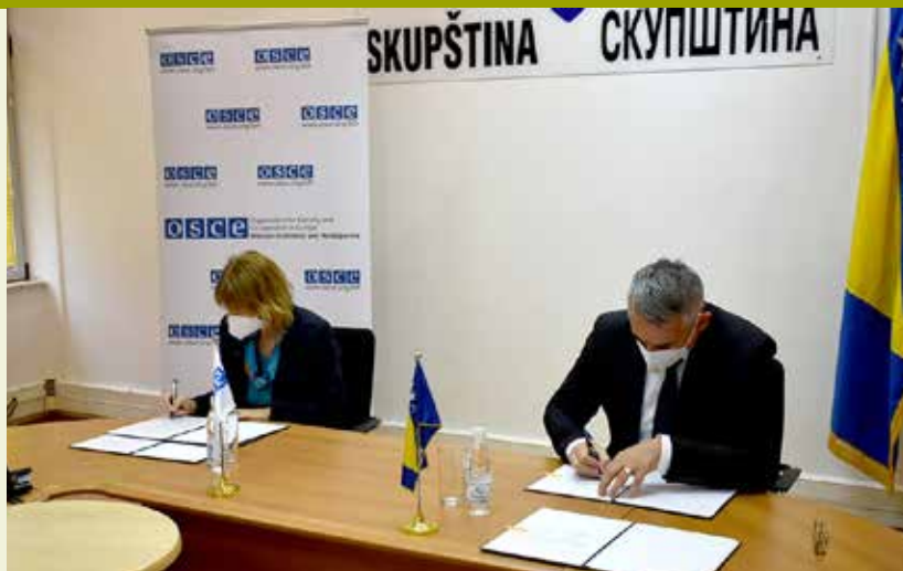
Потписивање меморандума о разумијевању између Скупштине и Мисије ОСЦЕ-а у БиХ 22. 10. 2021.