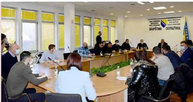
Припремни састанак за 20. редовну сједницу 3. 2. 2022.