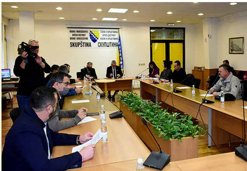
Припремни састанак за 18. редовну сједницу Скупштине

Стручна служба даје акредитацију новинарима који желе да прате рад сједнице Скупштине и њених комисија, а на основу одобрења захтјева који треба послати стручном савјетнику за односе с јавношћу.