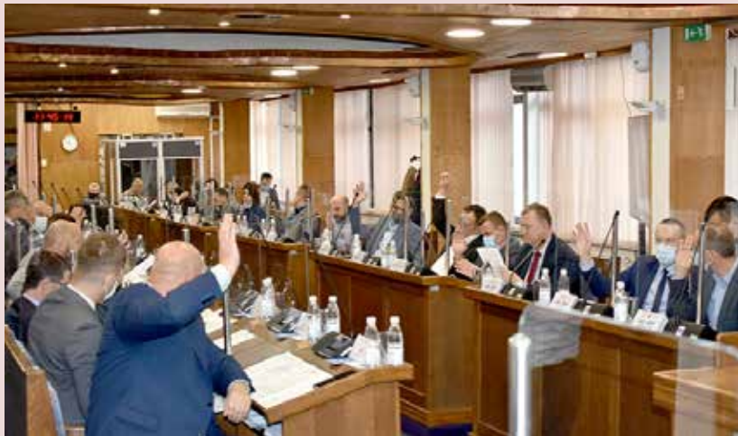
6. ванредна сједница 17. 11. 2021.

Посланици се бирају на локалним, слободним, отвореним и непосредним изборима, тајним гласањем, у складу са законима Босне и Херцеговине и Дистрикта.